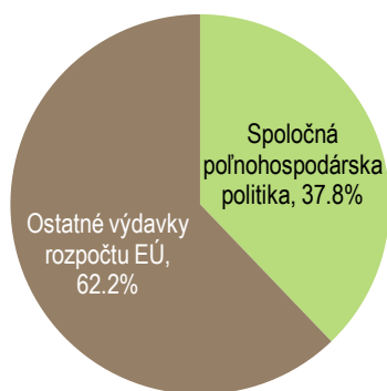
Graf 3: Podiel výdavkov SPP na celkovom rozpočte EÚ